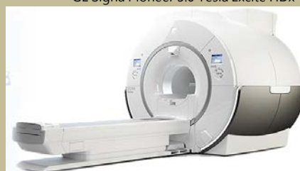
GE Signa Pioneer 3.0 Tesla Excite HDx