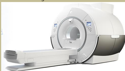
GE Signa Pioneer 3.0 Tesla Excite HDx